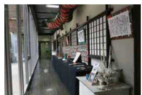
興味深い石州和紙の作品が立ち並ぶ。