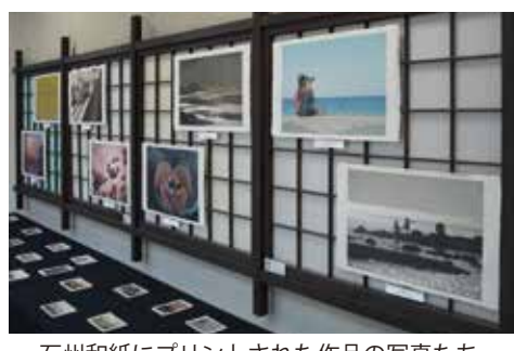
石州和紙にプリントされた作品の写真たち。

廊下の企画展―石州和紙を使った作品が展示される『廊下の企画展』。これまでに、企画した展示は、和紙プリント展、絵日記展、灯り展、展、絵日展、灯り展、こうぞぺんで描いた作品展、切り絵展、和紙人形展など。是非自分の作品を展示したいという方がおられれば石州和紙会館までご一報いただきたい。