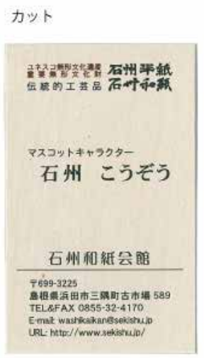
名刺のサンプル。石州和紙の温かみが心地よい名刺となっている。

和紙プリント―写真好きの方なら是非一度は試してもらいたい。石州和紙に自分の撮った写真が印刷出来てしまう。石州和紙に印刷された作品は、ギラギラせずなんだか優しい感じがする。サイズは最大A1(594x841ミリ)まで対応可能。A3サイズ1000円(和紙代・印刷費込)となつている。お申し込み方法はデータを石州和紙会館へご持参して頂き、印刷サイズ、カラー・モノクロの指定、希望の和紙も選べる。お気軽に石州和紙会館まで相談して頂きたい。年賀状や賞状の印刷なども、もちろん可能。